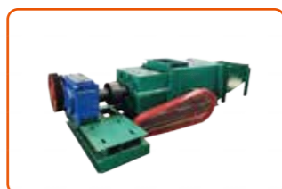
Mesin Press Sawit Screw Ganda/双螺旋榨油机