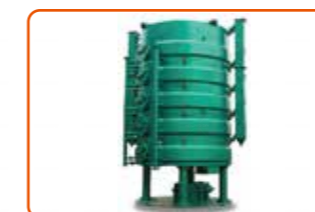
Penggorengan Uap 蒸汽炒锅