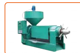
Mesin Press Inti Sawit 棕榈仁榨油机