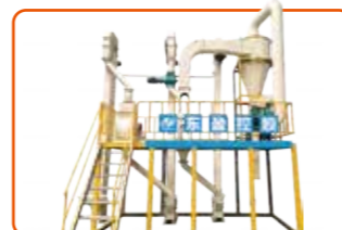
Pemisah Inti & Cangkang 仁壳分离机