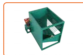
Perontok Sawit Kecil 小型脱果机