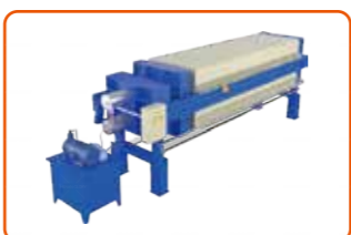
Filter Press Plat 板框压滤机