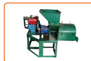
Mesin Press Sawit Screw Tunggal/单螺旋榨油机