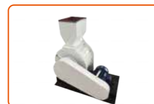
Pemecah Inti Sawit 棕榈仁剥壳机

处理量: 1-3 吨/时, 配备纤维分离、自动仁壳分离、预处理及压榨过滤系统, 结构紧凑, 功能完备, 性价比高。